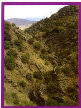
Vista de barranco secundario desde el sendero