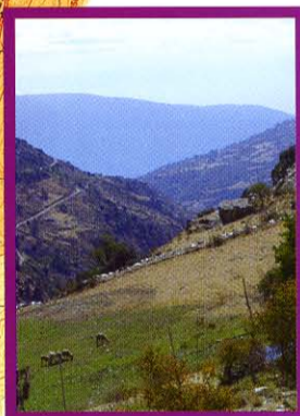
Vista del Barranco desde el sendero y al fondo la Sierra de Lújar