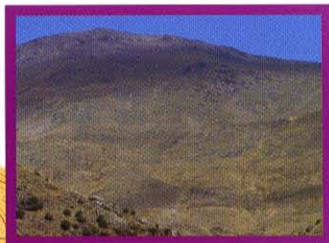
Ladera en la que se encuentra el Refugio del Poqueira