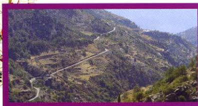
Vista del sendero de regreso hacia Capileira

Localización del itinerario: Sector suroccidental de Sierra Nevada.