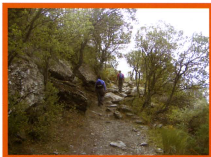
Sendero que culmina en el Peñón del Ángel y que es parte del GR-7

Periodo recomendable: Todo el año, pero especialmente en primavera y verano.