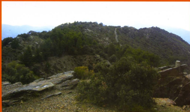
Vista desde el Peñón del Ángel

Una vez en Bubión podremos degustar las especialidades culinarias del Poqueira y adquirir algunos artículos de la artesanía de la zona.