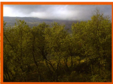
Chaparros y vista del Barranco entre nubes