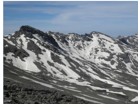
Corral y Carihuela del Veleta y Tajos de La Virgen 14-6-21