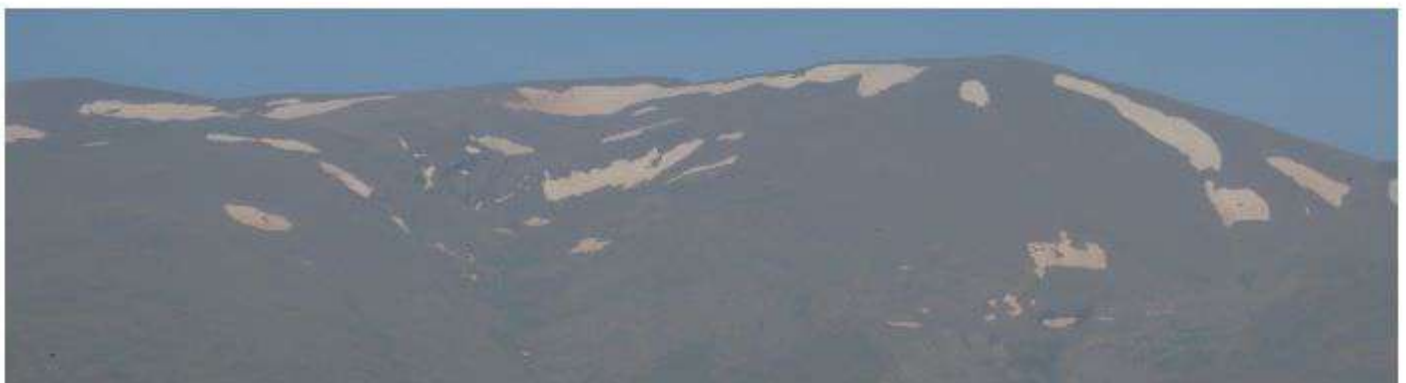
Picón de Jerez 25-6-26