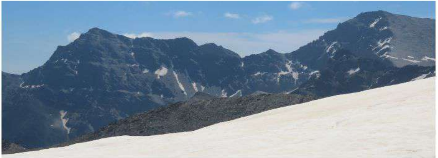
Alcazaba y Mulhacén 22-6-26